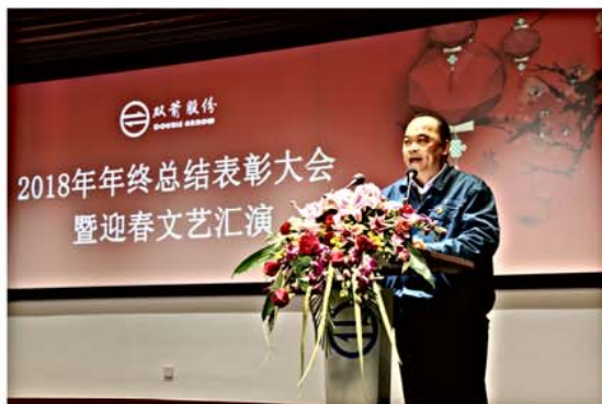
2018年年终总结表彰大会暨迎春文艺汇演